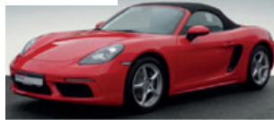
Porsche Zentrum Saarland