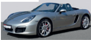
Porsche Zentrum Saarland