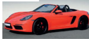
Porsche Zentrum Saarland