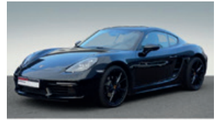
Porsche Zentrum Saarland

Porsche Boxster S , 232 kW (315 PS), EZ 03/13, 33.811 km, platin Silbermetallic, Kunstleder-ausst./Sportsitz Teilleder schwarz, Bi-Xenon-Scheinwerfer inkl. Porsche Dynamic Light System (PDLS), Porsche Communication Management (PCM) inkl. Navigationsmodul und universeller Audio-Schnittstelle, ParkAssistent hinten, Alarmanlage mit Innenraumüberwachung, Home-Link® (Garagentoröffner), Lenkradheizung, ohne Modellbezeichnung, Reifendruckkontrollsystem (RDK), Schaltgetriebe, Sitzheizung, Sound Package Plus, Vorrüstung Porsche Vehicle Tracking System (PVTS), 2-Zonen-Klimaautomatik, 20-Zoll Carrera S Rad u. v. m., EUR 51.888,-