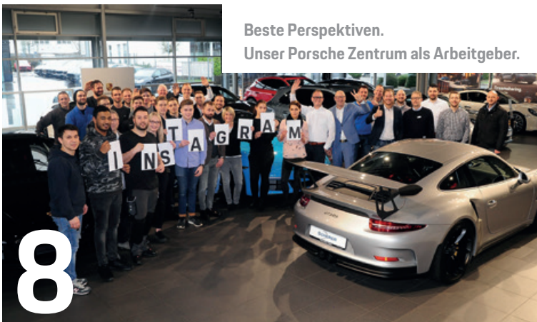
Beste Perspektiven. Unser Porsche Zentrum als Arbeitgeber.