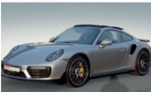
Porsche Zentrum Saarland