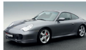
Porsche Zentrum Saarland