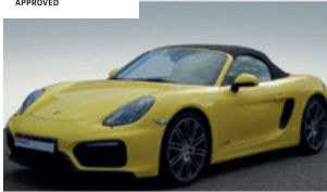
Porsche Zentrum Saarland