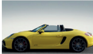
Porsche Zentrum Saarland