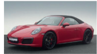
Porsche Zentrum Saarland

Porsche 911 Carrera S mit PDK, 294 kW (400 PS), EZ 04/15, 34.496 km, schwarz, KL-Ausst./ Sportsitz Plus bzw. Sportschalensitz Leder schwarz, Porsche Dynamic Light System (PDLs), PCM 3 – Grundmodul (inkl. Radio und Navigationsmodul), ParkAssistent vorne und hinten inkl. Rückfahrkamera, BOSE® Surround Sound-System, Telefonmodul, automatisch abblendende Innen-/Außenspiegel mit integriertem Regensensor, Sitzheizung, Sportabgasanlage, Sportsitze Plus (4-Wege, elektrisch), Tempomat, 20-Zoll Carrera S Rad lackiert in Platinum (seidenglanz) u. v. m., MwSt. ausweisbar, EUR 95.800,-