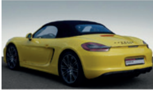
Porsche Zentrum Saarland