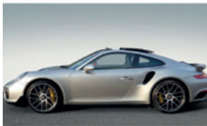
Porsche Zentrum Saarland