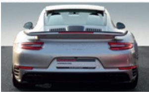
Porsche Zentrum Saarland