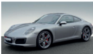
Porsche Zentrum Saarland