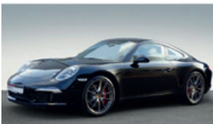
Porsche Zentrum Saarland

427 kW (580 PS), EZ 03/17, 4.809 km, GT-silbermetallic, Lederausstattung inkl. Sitze schwarz, LED-Hauptscheinwerfer schwarz inkl. Porsche Dynamic Light System Plus (PDLs+), Ablagenetz Beifahrerfußraum, Abstandsregeltempomat inkl. Porsche Active Safe (PAS), Aerokit 911 Turbo lackiert in Schwarz (hochglanz), Deckel Ablagefach mit Porsche Wappen, Digitalradio, elektrisches Schiebe-/Hubdach aus Glas, Fußmatten, Interieur-Paket lackiert (mit Lederausstattung), Licht-Design-Paket, Liftsystem Vorderachse, Multifunktion und Lenkradheizung, Porsche Wappen auf Kopfstützen, Raucherpaket, Servolenkung Plus, Sitzheizung, Sonnenblenden Leder, Spurwechselassistent, Tempolimitanzeige, 20-Zoll 911 Turbo S Rad u. v. m., EUR 186.900,-